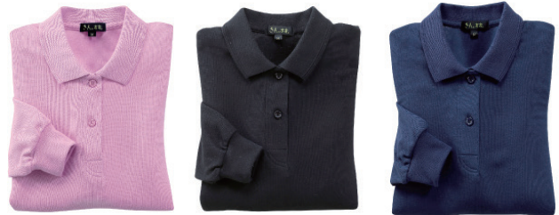
ローズ ブラック ネイビー