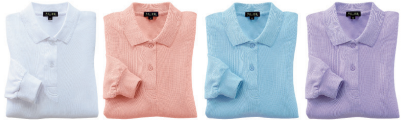
ホワイト ピンク サックス パープル