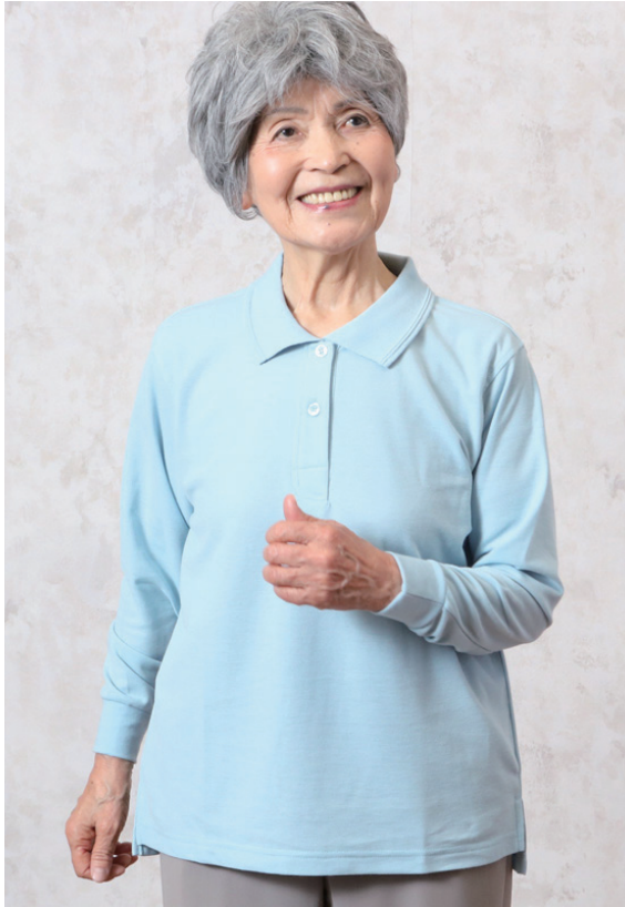
モデル身長 152cm M 着用