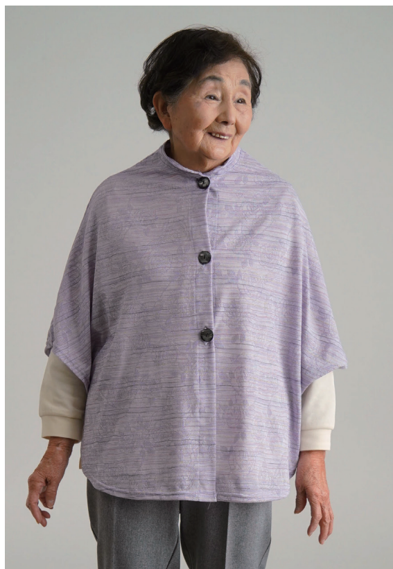
モデル身長 146cm フリー着用