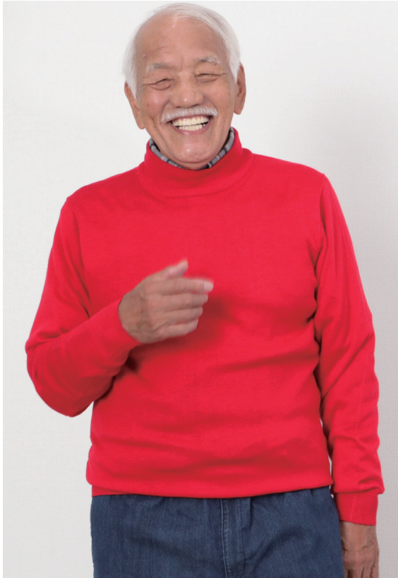
モデル身長 168cm L着用