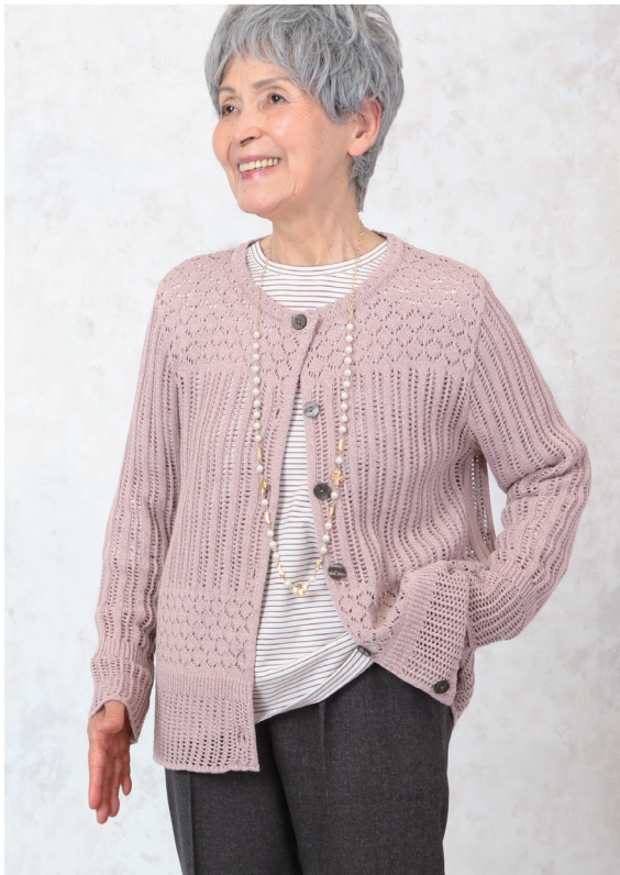
モデル身長 152cm M-L 着用