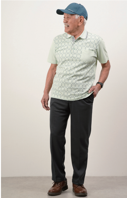
モデル身長 168cm L着用