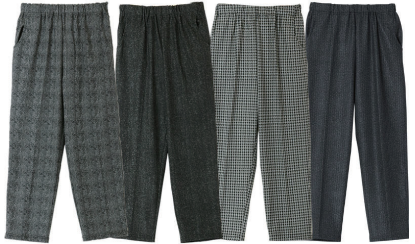
グレンチェック シャドー格子 千鳥 ヘリンボン