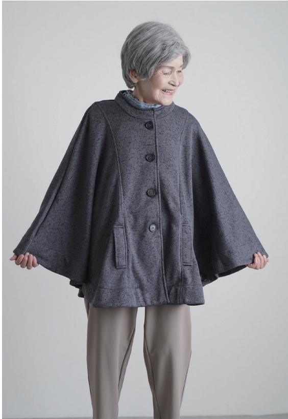
モデル身長 152cm M-L 着用