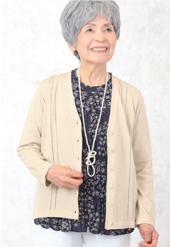
モデル身長 152cm M用